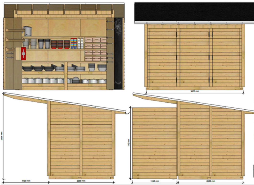
Tegninger – her vist med en køkkenindretning, som ikke vil være aktuel her.