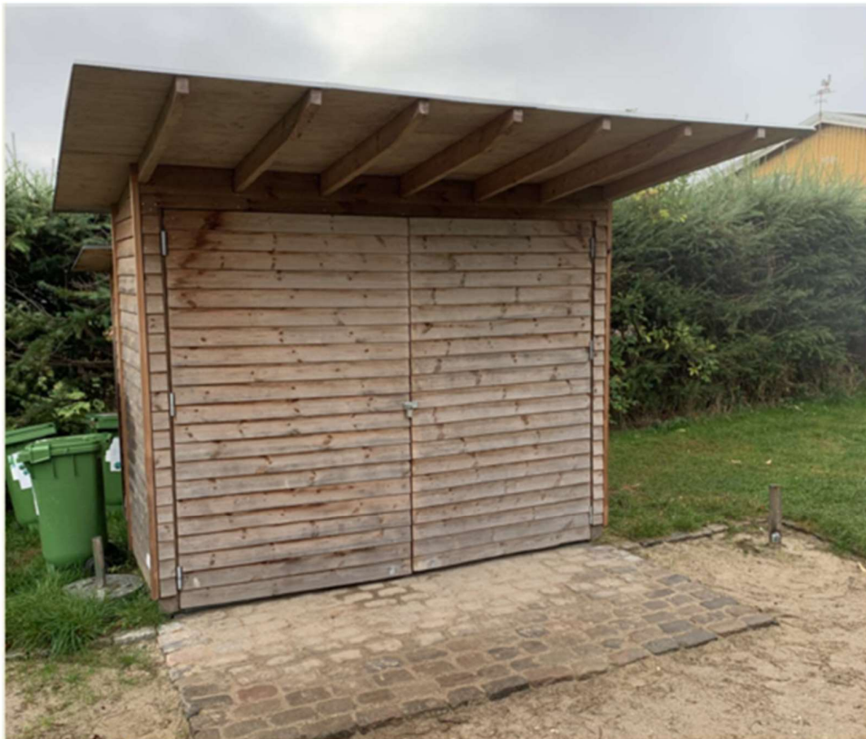
Eksempel på et sådant skur.